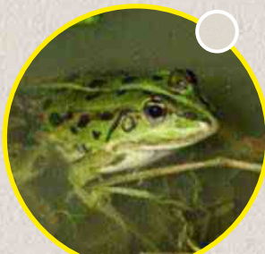
La grenouille verte