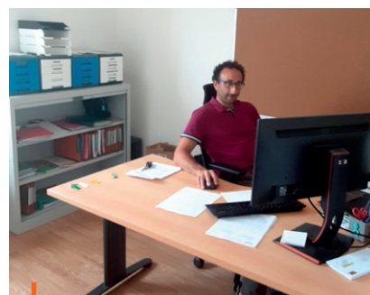
Nouvel espace de travail de l'Entente des Mauges

de longue durée. L'Entente des Mauges propose un programme personnalisé d'au moins 2 séances hebdomadaires et un bilan santé d'1h30 chaque fin de trimestre. La web application www.goove.fr permet au patient, médecin et enseignant en APA, d'avoir accès au programme d'activités et au bilan afin d'assurer un suivi pluridisciplinaire.