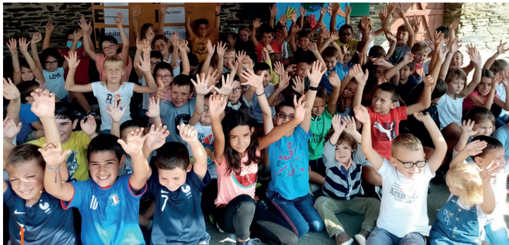
«Eco-citoyen, prends ton école en main !»