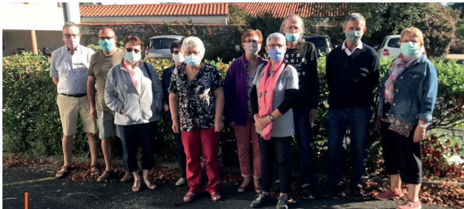
Bureau du Club des Aînés Théopolitains

Après concertation, les membres du bureau des Aînés ont décidé d'un commun accord et sans gaieté de cœur d'annuler toutes sorties, rencontres interclub, manifestations et activités. Le bureau de l'ARMHA a lui aussi décidé d'interrompre toute activité jusqu'à la fin de l'année. La vente annuelle prévue en novembre n'aura donc pas lieu.