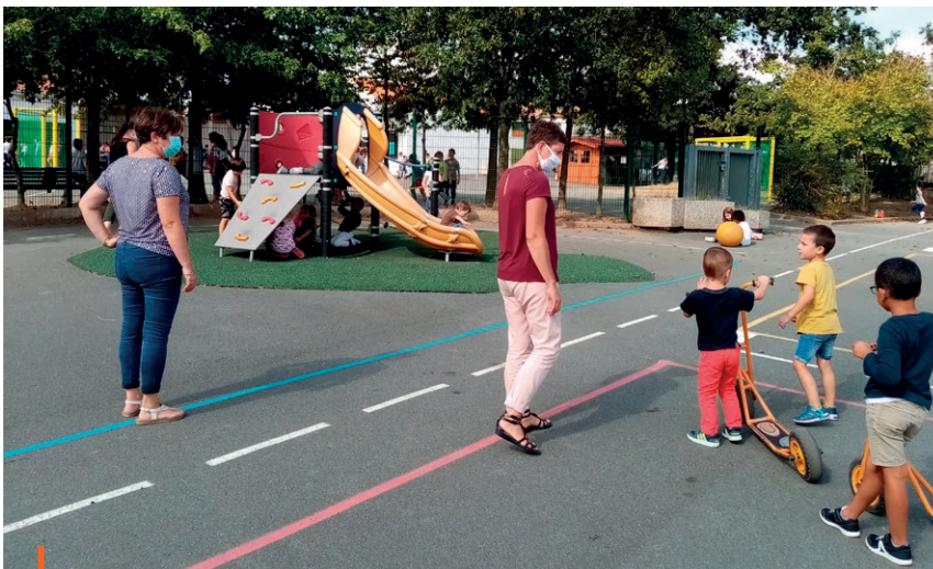
École Jules Ferry

et adolescents puissent continuer à s’éveiller et s’instruire dans ce lieu de savoirs qu’est l’école.