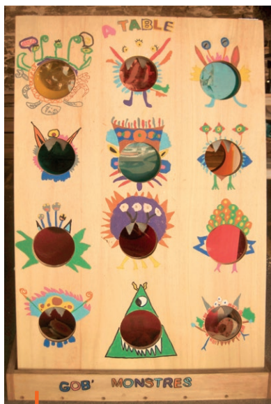
Le « Gob' Monstres », réalisé par les enfants de l'école Saint François d'Assise.

Les ateliers hebdomadaires du mercredi ont repris le 30 septembre. Les prochains stages de fabrication de jeux en bois (enfants à partir de 7 ans) se tiendront du 19 au 23 octobre de 14h à 17h, à l'atelier (22 rue de la Bouère à Jallais). Chaque participant repart de l'atelier avec sa propre fabrication. Sur réservation, sous réserve de places disponibles et de l'évolution de la situation sanitaire.