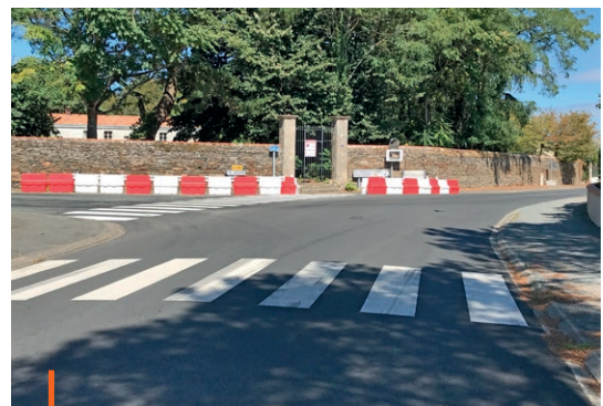
Carrefour rue du Christ Roi

Afin de réduire la vitesse des véhicules, le département teste de nouvelles règles de priorités au niveau de la rue d'Anjou et de la rue des Chevaliers de Malte. Désormais, les véhicules arrivant des rues du Christ Roi et de la rue du petit Manoir sont prioritaires par rapport à l'axe principal de circulation (priorité à droite). L'assimilation de ces nouvelles règles peut prendre du temps. Restons vigilants !