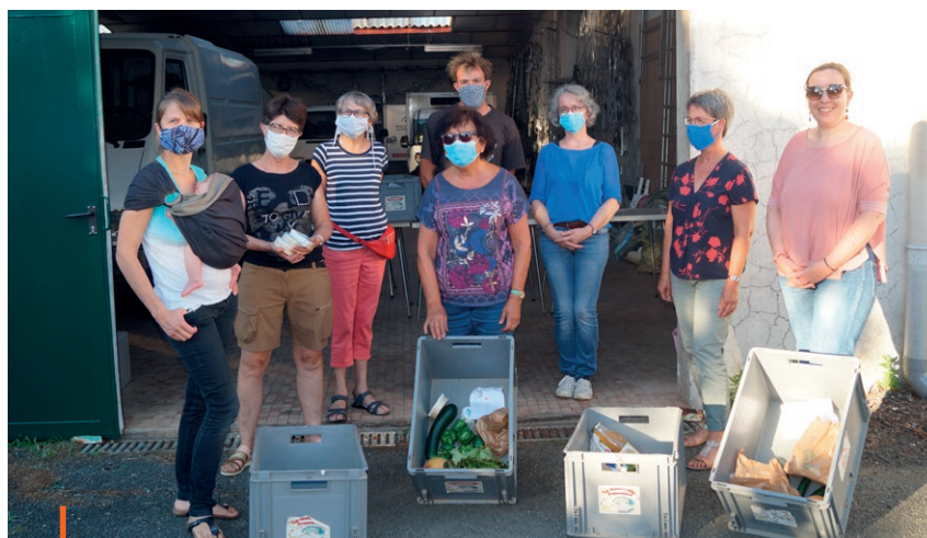
Bénévoles de la distribution