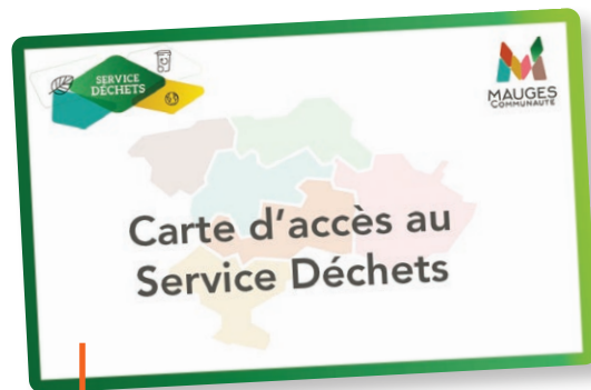
Nouvelle carte d'accès à la déchèterie

Cette nouvelle carte vous permettra d'accéder à l'ensemble des déchèteries du territoire de Mauges Communauté.