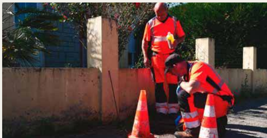
A l'extérieur du logement, les agents municipaux vérifient le bon écoulement du liquide coloré.