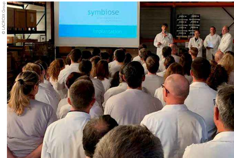
Fin juin, la direction de LACROIX Group a informé ses salariés du déménagement de son usine d'électronique de Saint-Pierre-Montlimart à Beaupréau.

LA NOUVELLE USINE 4.0 DE LACROIX ELECTRONICS SERA CONSTRUITE SUR LA COMMUNE DÉLÉGUÉE DE BEAUPRÉAU. LES 450 SALARIÉS TRAVAILLERONT AINSI À QUELQUES KILOMÈTRES DE L'USINE DE SAINT-PIERRE-MONTLIMART. CE CHOIX CONFORTE LE PÔLE STRUCTURANT BEAUPRÉAU-EN-MAUGES/MONTREVAULT-SUR-ÈVRE AU CŒUR DES MAUGES. SUR LE SITE ACTUEL DE LACROIX, MAUGES COMMUNAUTÉ VA CRÉER UN ESPACE OUVERT DÉDIÉ À L'INNOVATION, À LA FORMATION ET AU TOURISME D'AFFAIRES.