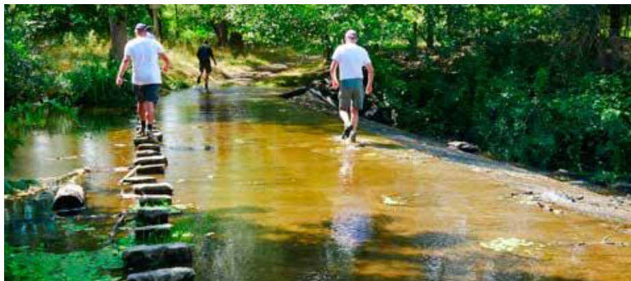
Passage de gué à Notre Dame-du-Marillais