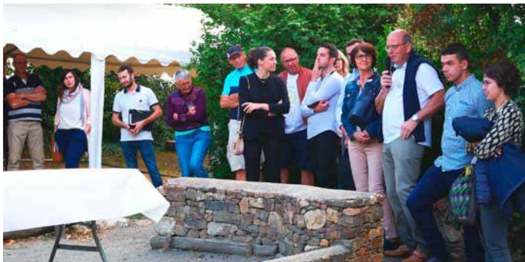
Echanges avec les porteurs de projet

*Article autour de plusieurs axes (environnement, industrie, artisanat et commerce, sport), le projet « Cœur des Mauges » vous sera présenté en détail dans le prochain Mag.