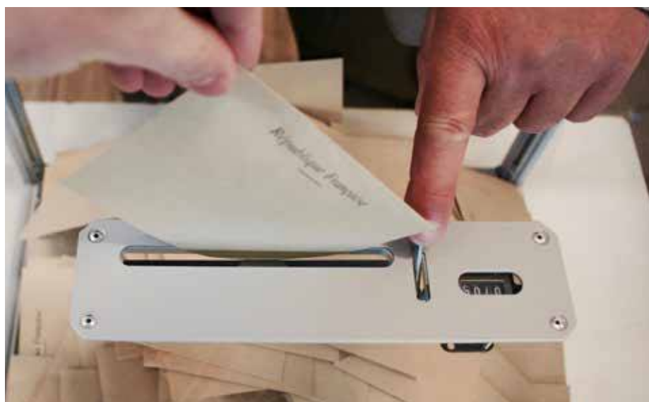
Les élections municipales auront lieu les 15 et 22 mars 2020.

Les demandes d'inscription sur les listes électorales, en vue de participer aux scrutins, devront être déposées au plus tard le vendredi 7 février 2020.