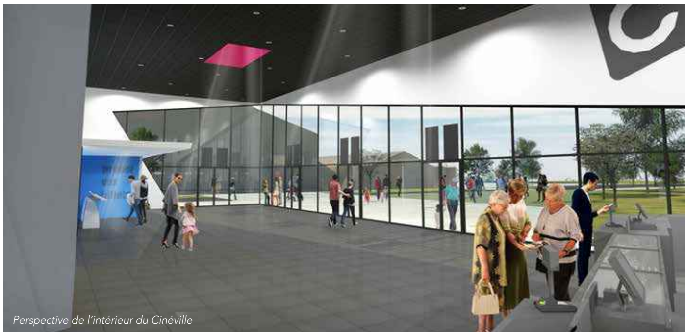
Perspective de l'intérieur du Cinéville

* Le projet de la nouvelle médiathèque sera abordé dans un prochain Mag.