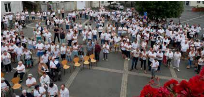
Interpellées par la désertification médicale en milieu rural, 700 personnes se sont rassemblées pour faire venir des praticiens sur la commune

DEUX MÉDECINS GÉNÉRALISTES ONT CESSÉ LEUR ACTIVITÉ RÉCEMMENT. SUITE À CELA, ÉLUS ET PROFESSIONNELS DE SANTÉ DE BEAUPRÉAU-EN-MAUGES SE SONT RASSEMBLÉS POUR FORMER UN COLLECTIF « SANTÉ EN DANGER ».