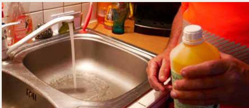
Pour visualiser l'écoulement des eaux usées, un colorant est versé dans les canalisations depuis les éviers, douche et WC du domicile.

Les travaux d'effacement rue Chaperonnière à Jallais ont démarré. Sur le même principe, seul le réseau souterrain est installé. Dans un second temps, l'entreprise réalisera la dépose des anciens candélabres puis la pose des nouveaux et leur raccordement.