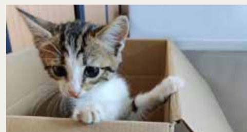
Ce chaton abandonné a été adopté et baptisé Pom'Potes.

L'identification des chats est obligatoire. Elle vise à lutter contre les abandons, réduire le nombre de félins errants ainsi que les erreurs de fourrière. Les propriétaires sont tenus de faire tatouer ou pucer leur animal chez un vétérinaire. Le coût de l'acte est variable mais il est toujours moins élevé que l'amende à laquelle s'expose un propriétaire qui ne serait pas en règle.