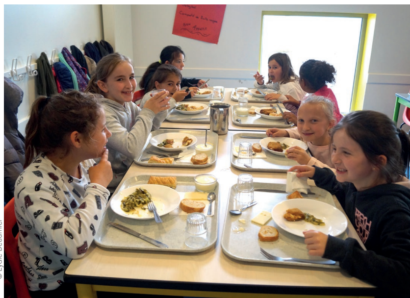
Les enfants déjeunant dans les trois restaurants scolaires viennent de cinq écoles primaires de Beaupréau-en-Mauges.