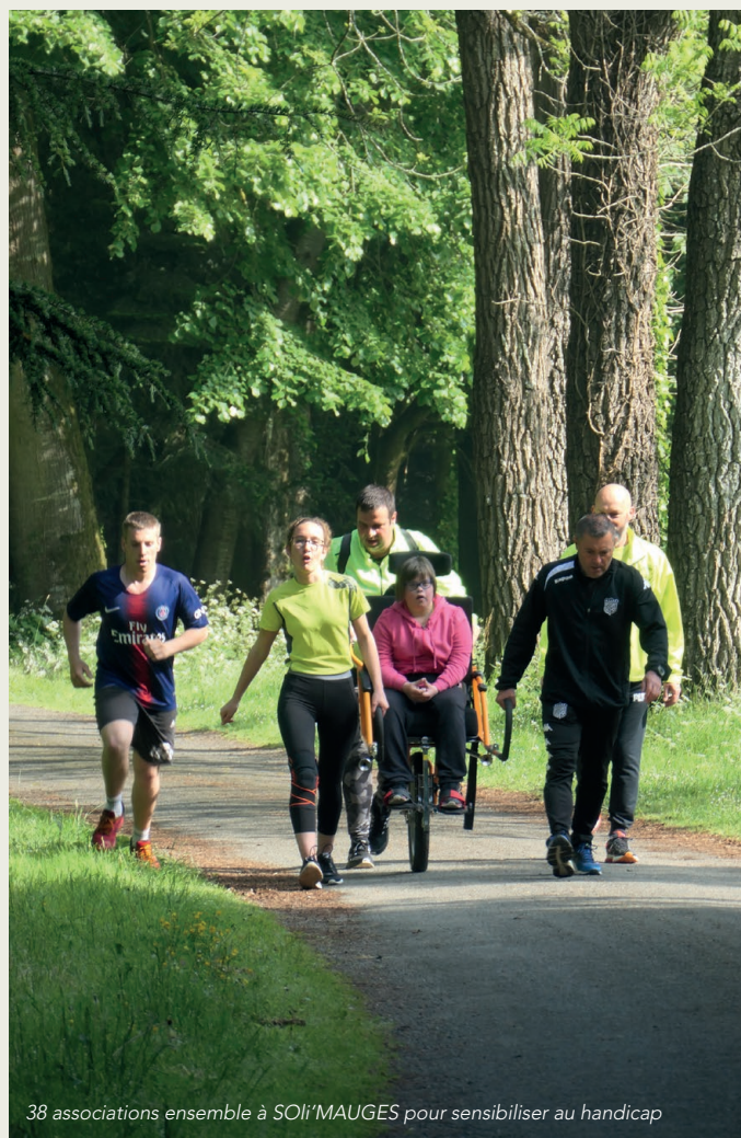
38 associations ensemble à SOLi'MAUGES pour sensibiliser au handicap