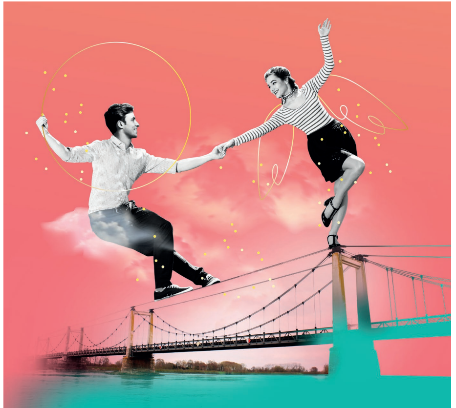
Visuel de la saison 2019-2020 de Scènes de Pays