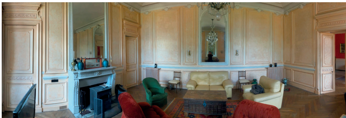
Salon d'honneur du Château de la Brulière

LES SAMEDI 21 ET DIMANCHE 22 SEPTEMBRE, DÉCOUVREZ OU REDÉCOUVREZ BEAUPRÉAU-EN-MAUGES SOUS UN AUTRE CIEL À L'OCCASION DES JOURNÉES EUROPÉENNES DU PATRIMOINE. LES ANIMATIONS PROPOSÉES GRATUITEMENT DONNERONT À ENTENDRE DES HISTOIRES PARFOIS ÉMOUVANTES OU DRÔLES DU PASSÉ DE LA COMMUNE.