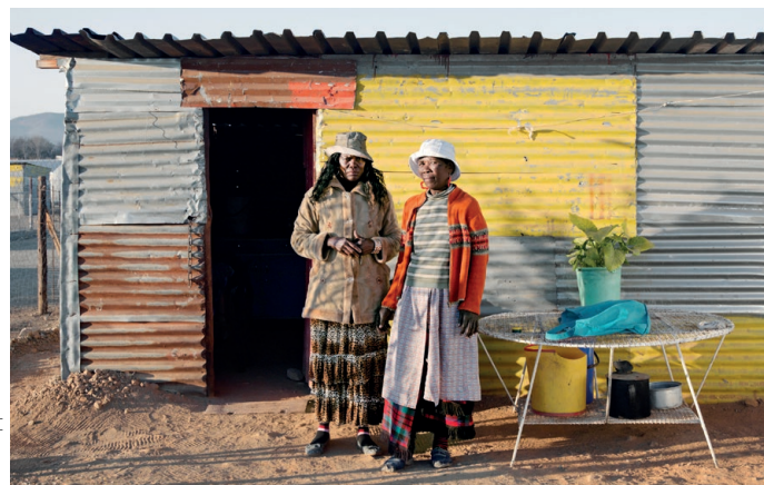
Datazone #6 - Marikana - Afrique du Sud, 2012

Il nous conduit à Flint pour évoquer les problèmes d'une désindustrialisation chaotique, fait un détour par l'Antarctique pour témoigner des conséquences du dérèglement climatique. Il nous entraîne ensuite à Dharavi au cœur du second plus grand bidonville du monde. Europe, Amérique, Afrique, Asie, c'est le monde entier qui hurle à nos yeux. Aucune trêve en vue.