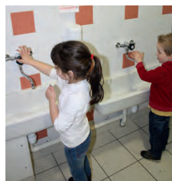
Apprentissage de l'autonomie (Jallais)