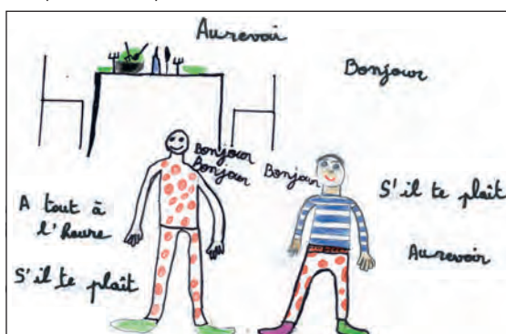
Dessin des formules de politesse (Andrezé)