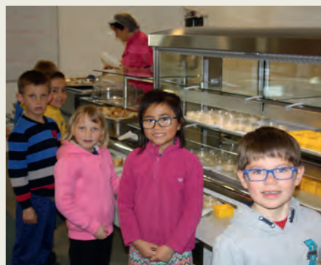
Self-service à Villedieu-la-Blouère

vices (gestion des flux sur un temps réduit), tout en prenant en compte le temps de pause des enfants.