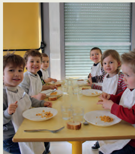
Restauration des élèves de maternelle à Jallais

De nombreuses valeurs sont mises en avant: apprentissage de l'autonomie pour les plus petits, respect de l'autre (autres enfants et aussi adultes