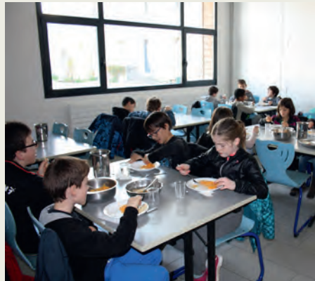
Restauration des élèves de primaire à Andrezé