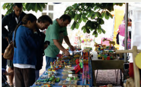
Office de tourisme

Après avoir soufflé ses 10 bougies l'an dernier, le Marché des Passions qui met à l'honneur des savoir-faire et des passions, replante son décor le temps d'un week-end dans la cour du château de Beaupréau. 2 jours, 2 ambiances différentes : le samedi, un marché nocturne et le dimanche, le traditionnel marché de journée accompagné du vide-greniers. Restauration sur place, animations. Entrée gratuite.