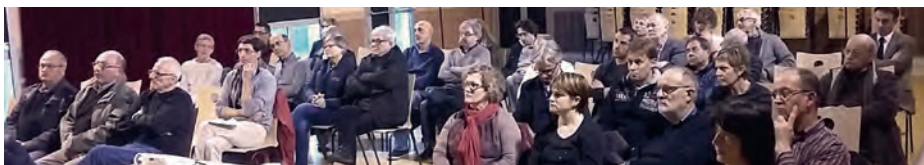
Réunion publique du 13 avril 2016 à la Maison commune des loisirs à Gesté

La deuxième étape du PLU sera l'occasion de dresser le projet de territoire pour les dix prochaines années. Les futures réunions publiques sur ce sujet se dérouleront à la fin de l'année 2016, nous vous y attendons nombreux !