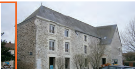
◀ La maison de santé de Jallais ▼ La maison de santé de Gesté