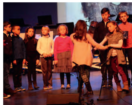
Concert de l'école de musique, le 29 avril 2016