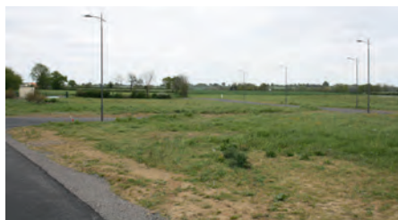
Zone de la Pierre Blanche

• Sur l'Anjou Actiparc Centre Mauges, l'entreprise "Maison Bretaudeau" est en cours de construction sur un terrain de 1 500 m 2 , la microcrèche 1, 2, 3... à petit pas double sa surface et sa capacité d'accueil d'enfants. Sur cette zone un compromis de vente est également signé avec la société Gan Assurance pour le transfert de son activité aux côtés du salon de toilette.