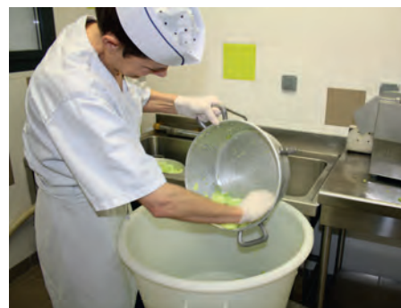
Restaurant autogéré à Gesté

C'est le cas à La Poitevineière, à Gesté et à Villedieu-La-Blouère.