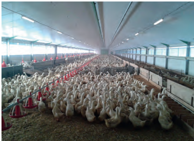
AAID – Installation de l'éclairage d'un bâtiment d'élevage