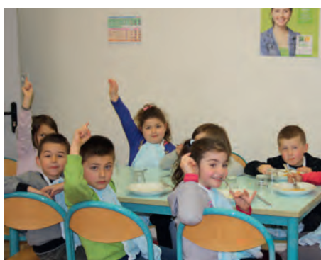
Application des règles de vie en groupe (La Jubaudière)

en place. Cette méthode permet aux enfants d'apprendre les règles de vie de façon ludique.