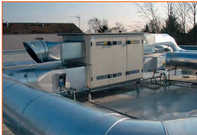
THESIS – Conception d'une centrale de traitement d'air

L'activité d'Agri Agro Industrie Développement est quant à elle spécialisée dans les études, l'installation, le dépannage et la maintenance des équipements des bâtiments d'élevage au sein d'exploitations agricoles. Ces deux sociétés développent des solutions dans le domaine du génie électrique et climatique, mais dans des secteurs d'activités bien distincts. Ainsi, les projets de Thesis sont majoritairement en réponse à des ap-