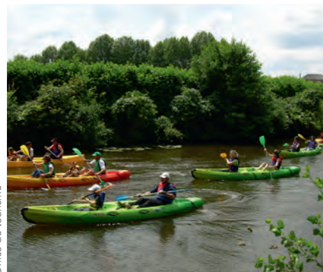
Office de tourisme

Un moment convivial vous attend au cours de cette balade en barque, canoë ou kayak mis en place en partenariat avec le Club des Onglées. Abordez les rives de l'Èvre au cœur du parc avec un œil différent, et profitez en silence ou en éclats de rire de la faune et de la flore qui vous entourent... Au départ des douves du château.