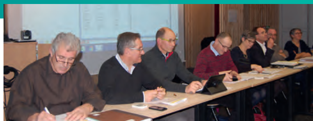
Séance du Conseil Municipal du 26 janvier 2016

Maire de la commune de Beaupréau-en-Mauges Vice-Président de Mauges Communauté